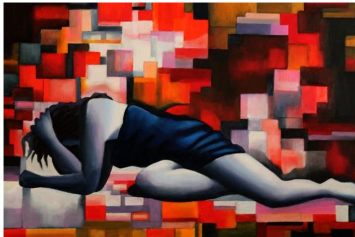
L'immagine del dipinto è stata gentilmente concessa dall'autore: il Maestro Gaetano Salerno a cui va tutto il nostro ringraziamento.